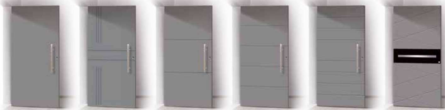
FLAT ARGEA FEBA FILA NILA TALUS

La linea Groove è essenziale e raffinata, adatta a chi ricerca uno stile sobrio e minimale. Le sue linee rigorose creano interessanti geometrie che si sposano alla perfezione con architetture classiche ma anche con quelle contemporanee. Vanta parametri di isolamento termico di tutto rispetto (0,85W/m 2 K) che la rendono adatta anche a costruzioni a basso consumo energetico. Lo spessore delle lastre la rendono robusta e molto resistente. Al suo interno è stato inserito un rivestimento termico in polistirene estruso XSP in modo da garantire resistenza al fuoco e migliorare il risparmio energetico.