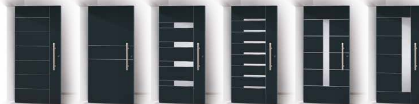
TERENCEUS HERON ERAST KOSMA ARETAS AGAPIT

Con la linea Intarsio l'ingresso di casa assume una nuova dimensione grazie agli effervescenti giochi di luce che filtra briosa dai suoi elementi trasparenti. Portoncini adatti a personalità estrose, si sposano con architetture pensate per non passare certo inosservate. Ma Intarsio non è solo bella, è anche estremamente sicura e resistente. Come tutti i portoncini Tervis garantisce un alto isolamento termico (0,85 W/m 2 K) e un elevato standard di sicurezza essendo dotate di blocco automatico dell'anta in tre punti e una rosetta ad anello in grado di contrastare i possibili tentativi di effrazione.