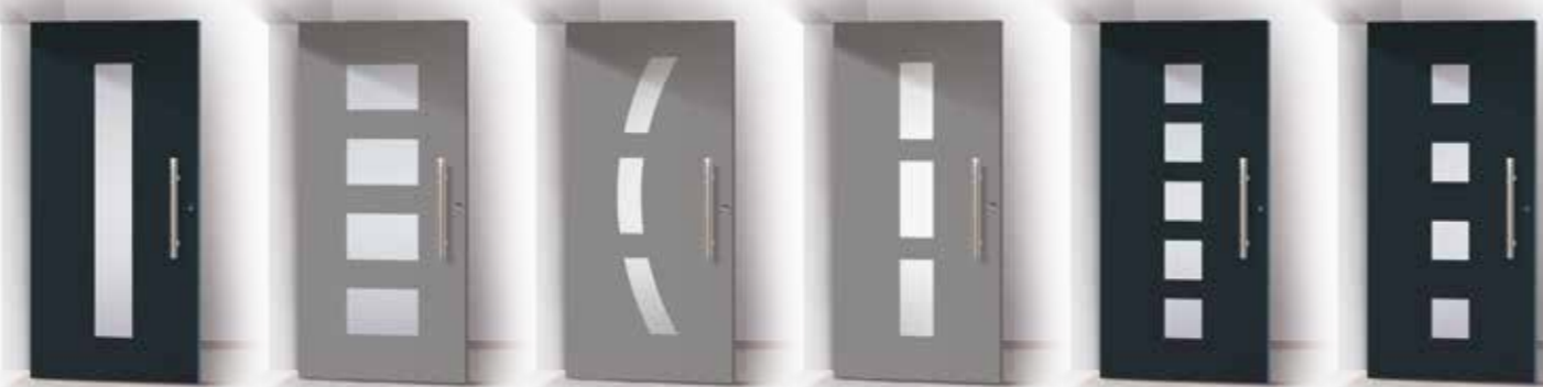
RAISA GRETA CYNTIA KALISTA SOTERA IDALIA

Se ricerchi uno stile dal sapore retrò e linee che rimandano a uno stile classico, queste porte d'ingresso ti conquisteranno. La linea Classic, con i suoi giochi di pieno e vuoto sfrutta le trasparenze per integrarsi in contesti tradizionali esaltandone l'estetica curata. Non solo belle, ma anche estremamente sicure e isolanti, si adattano alla perfezione sia in un appartamento che in una villetta indipendente grazie alla loro resistenza alla deformazione e alla ruggine. Sono provviste di chiusura automatica che blocca l'anta in tre punti senza utilizzare la chiave e di una rosetta ad anello in grado di fornire una solida protezione dai tentativi di scasso.