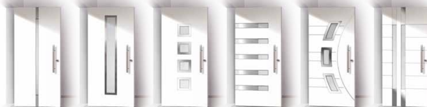
ADORA TITUS LAR PAULUS VESTA PUBLIUS

La più preziosa delle quattro linee, Inox si distingue per la sua irresistibile bellezza arricchita dall'eleganza dell'acciaio inox e la leggerezza del vetro che disegnano le sue geometrie. Per i cultori del design più audace e senza compromessi è un portoncino che sa donare a ogni ingresso un allure che lascia il segno. Solida barriera contro i tentativi di effrazione può essere integrata con gli innovativi sistemi di Smart Home che consentono di aprire la porta comodamente dallo smartphone, con un telecomando o con un lettore di impronte digitali.